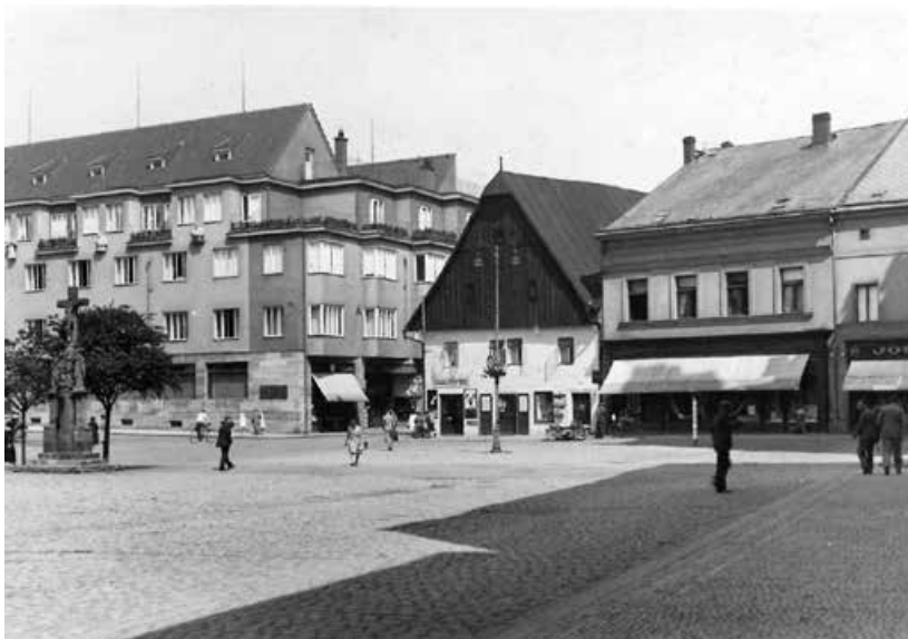
Náchod čp. 32 (roubenka uprostřed) asi 1946