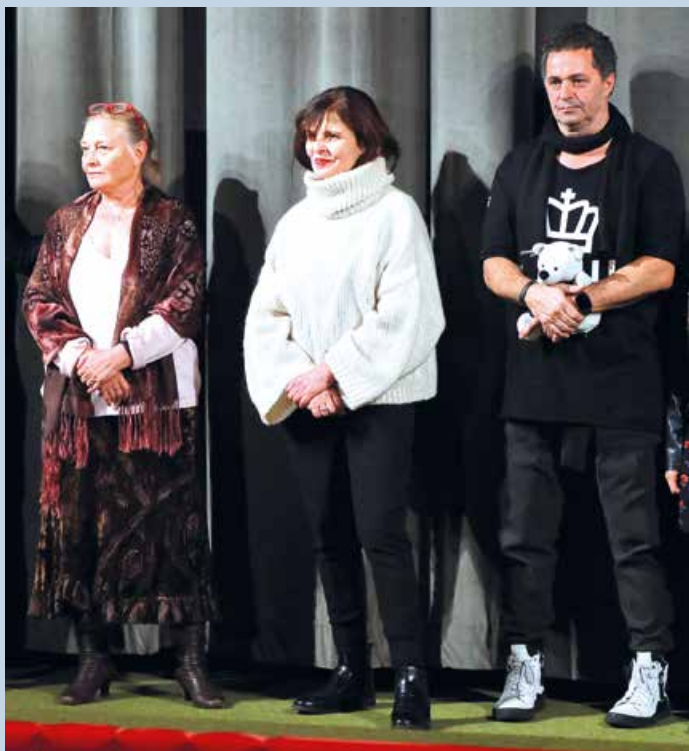
Milí hosté romantické komedie Ženská na vrcholu – herci Jana Preissová, Jana Krausová a Martin Dejdar