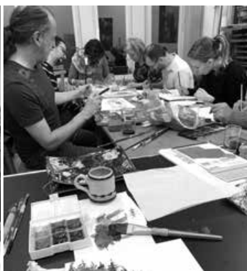
Tvorba akvarelu v ateliéru