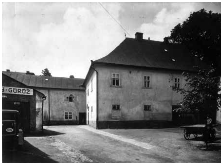
Náchod - obecní dům čp. 67