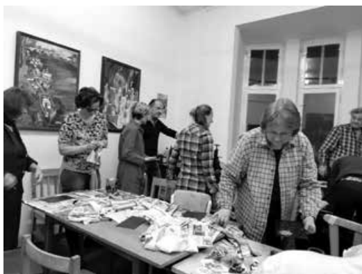
Tvorba barevného monotypu