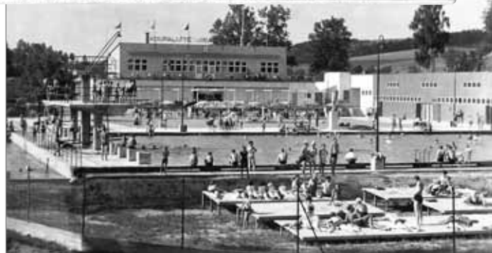
Koupaliště Jiráskova kraje s restaurací