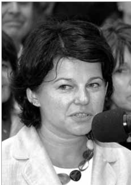
Náchodský zpravodaj říjen 2009