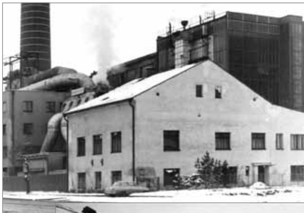
U Terčů (stav před demolicí)