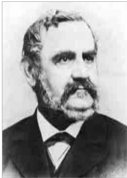
František Ladislav Rieger