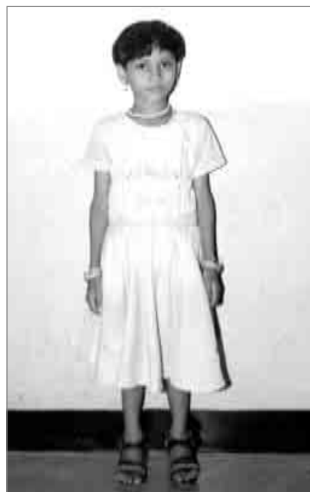
Motto autora výstavy zní: Fotografie mirdala poznat čtvrtý rozměr lidského žití.

Výstava je složena ze tří cyklů, portréty sportovců s vážným zdravotním postižením, portréty špiček evropského autokrosu včetně autogramů a portréty filmových režisérů také včetně autogramů.