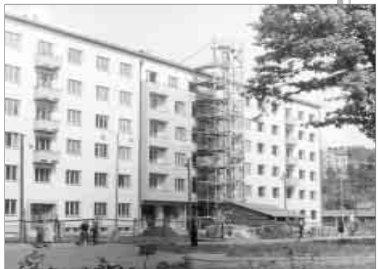
Obytné domy v Kladské ulici proti nádraží postavené v 50. letech 20. století na místě zbourané továrny.