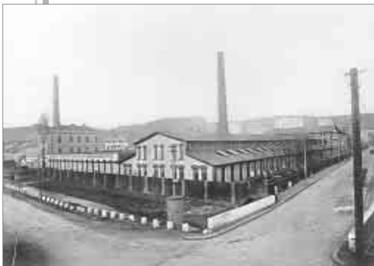
Pohled do Plhovské a Kladské ulice v roce 1900, kdy v jejich nároží stála továrna firmy E. Doctor.