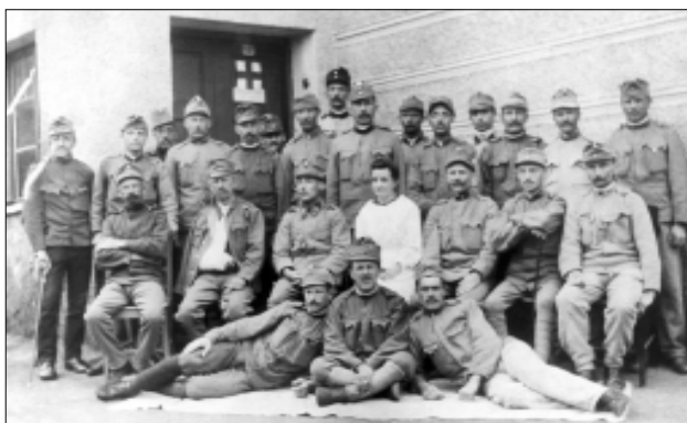
Osazenstvo jednoho z vojenských lazaretů v Náchodě za I. světové války