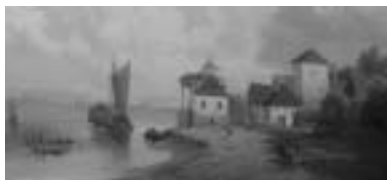
Monogramista J B Holandsko 1871 olej na plátně

V ýstava romantických a žánrových obrazů do 15. 12.