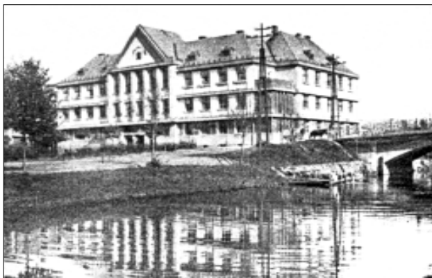
Okresní dům v Náchodě