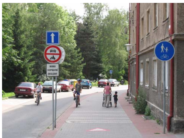
Obr. 3.19b: Příklad řešení vedení stezky pro chodce a cyklisty se společným provozem jednosměrnou komunikací (Liberec)