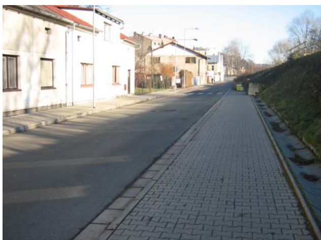
Obr. 3.19a: Ulice Volovnice (pohled směrem z centra) – současný stav