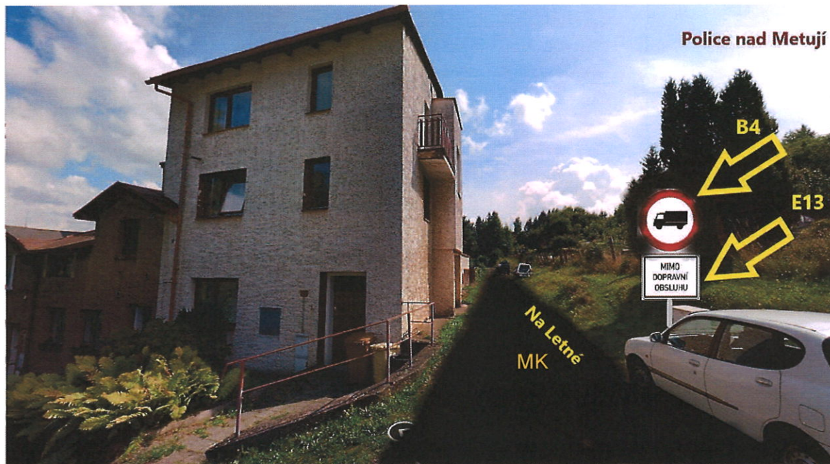
obr. 2a - návrh DZ „B4+E13“ – ul. Na Letné - sever