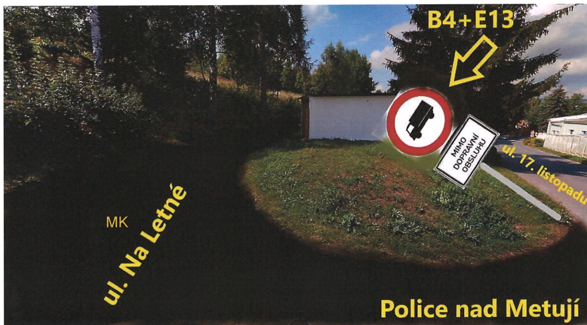
Obr. 2b – návrh DZ „B4+E13“ – ul. Na Letné - jih