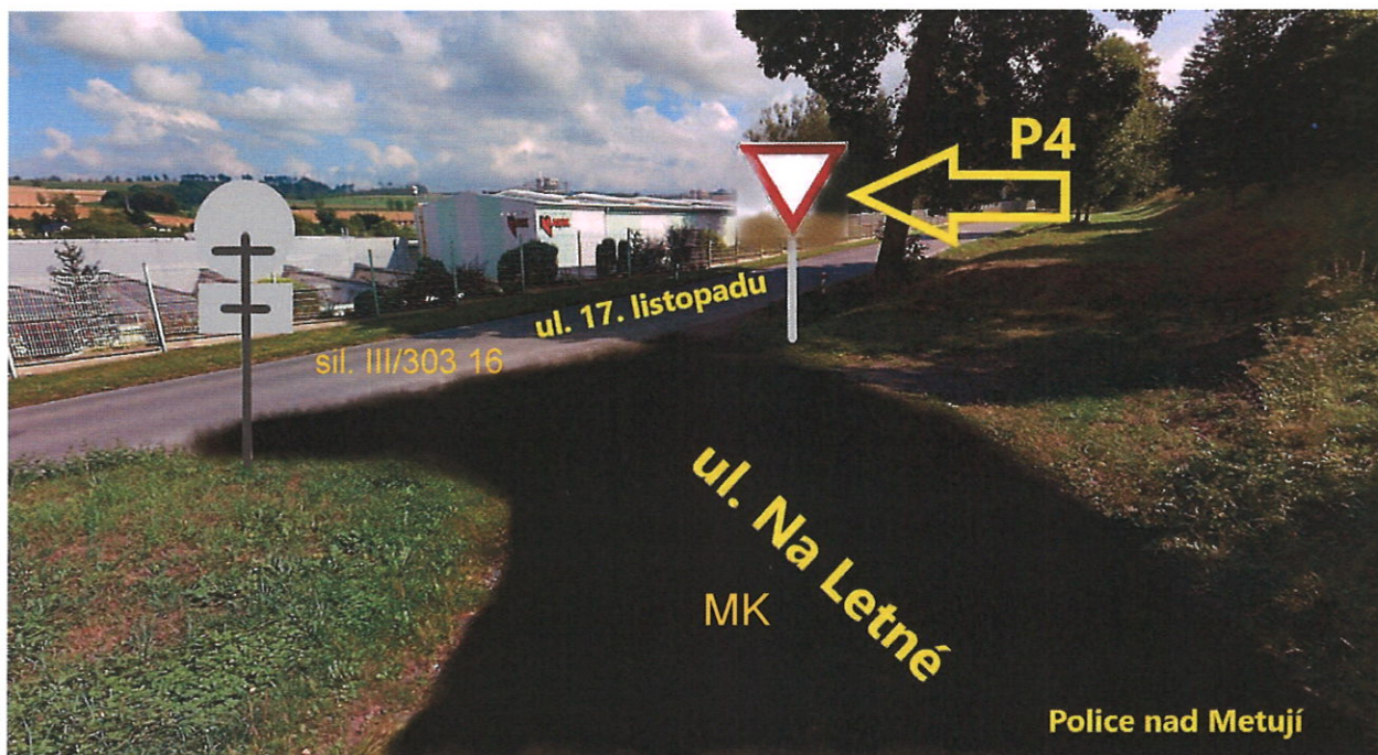
Obr. 2c – návrh DZ „P4“ – ul. Na Letné - jih