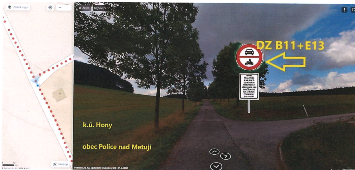
obr. 2 - návrh DZ „B11+E13“

ad 3) Katastrální mapa s vrstvou ortofoto - zákres umístění nového DZ