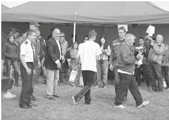
FOTO: Předání putovního pohár SDH Vysokov