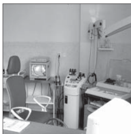
Pohled na novou vyšetřovací jednotku ATMOS C 31

Město Náchod prodá pozemkovou parcelu pro stavbu rodinného domu v ul. V Třešinkách v Náchodě. Základní cena 400 Kč/m 2 .