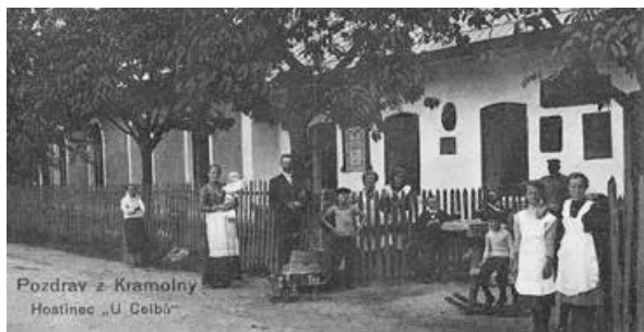
Zvuk orchestrionu v tanečním sále hospody, která patří jeho dědečkovi, byl pro Jaroslava Celbu v dětství silným hudebním zážitkem, který ho ovlivnil pro celý život.