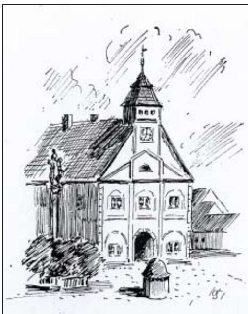
Radnice po přestavbě v r. 1828 (kresba K. Š.)