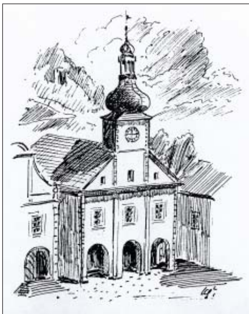
Podoba náchodské radnice z r. 1665 na kresbě Karla Šafáře

písemnostech, a tato pokračující byrokratizace magistrátních úředníků i veřejného života prosadila postupně jednotné používání němčiny.